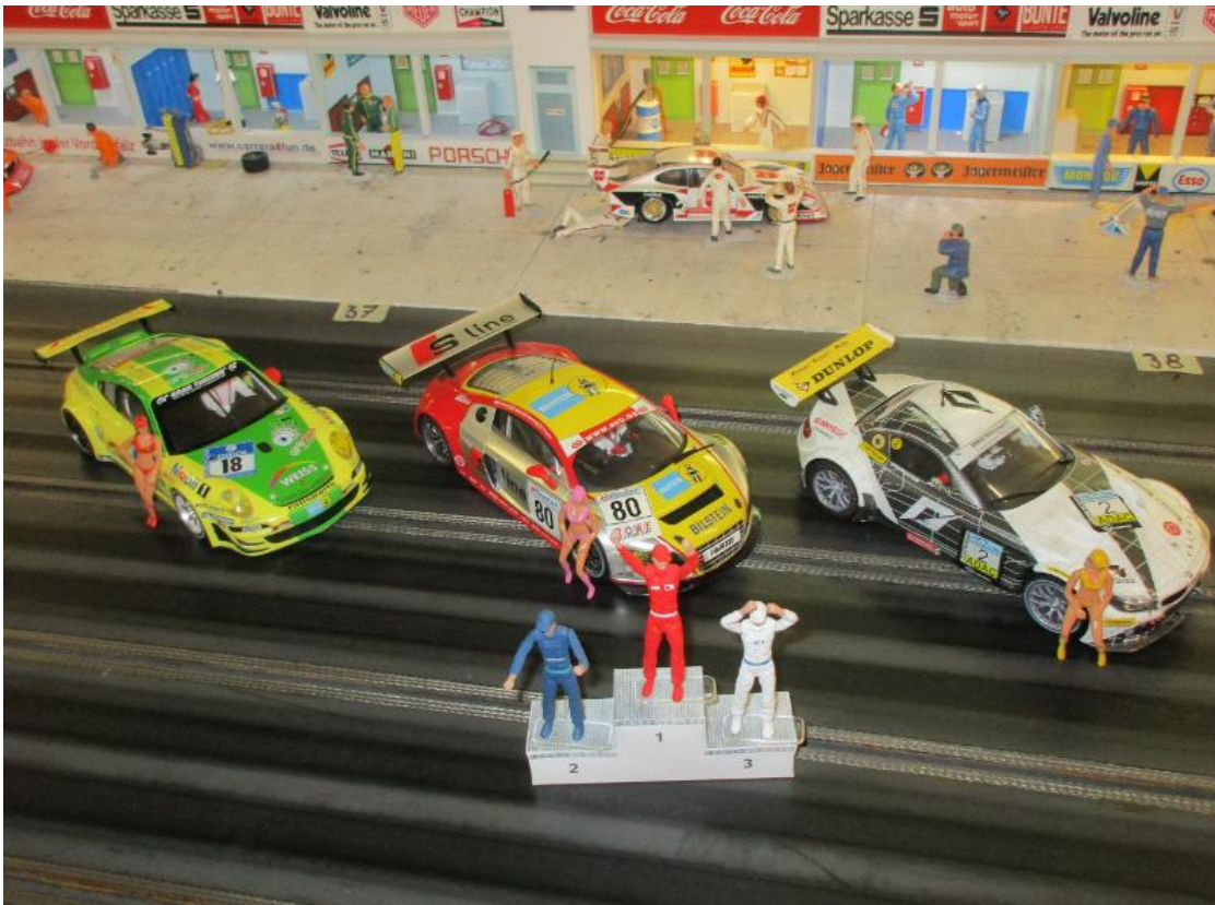
Dirk G. Platz 2