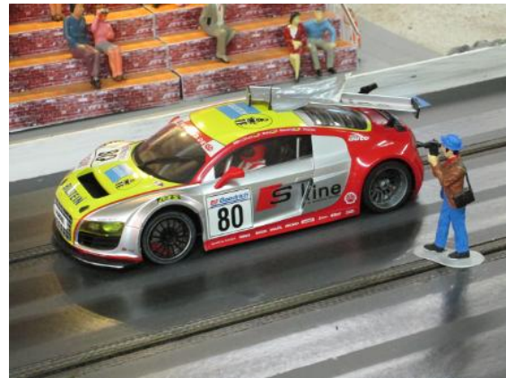
Audi R8 LMS von Andreas K.