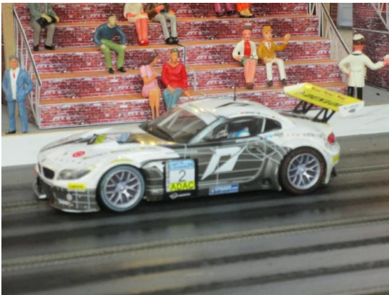
BMW Z4 GT3 von Frank S.