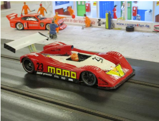
Ferrari 333 SP Momo von Sven F.