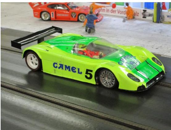
Jaguar XJ9R Camel von Dirk A.