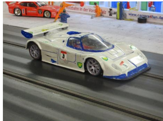
Jaguar XJ9R BP von Karl-Heinz St.