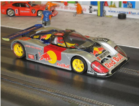
Jaguar XJ9R Red Bull von Martin F.