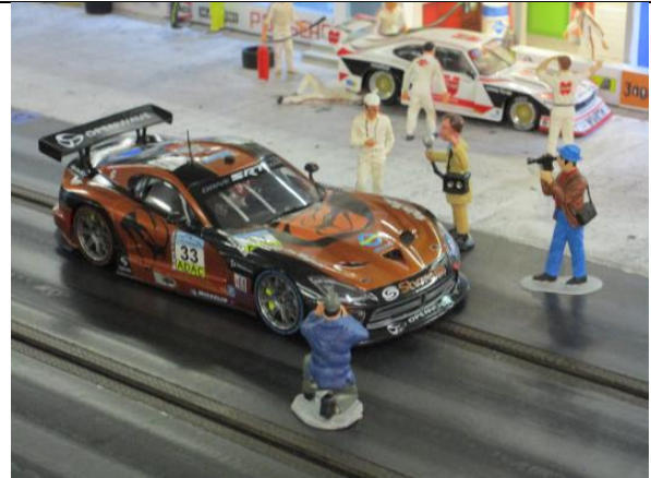
Markus S.: Viper GTS-R