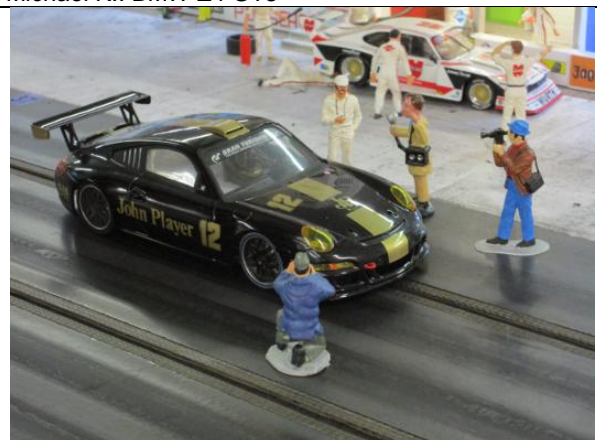
Kai M.: Porsche 997 GT3 Cup