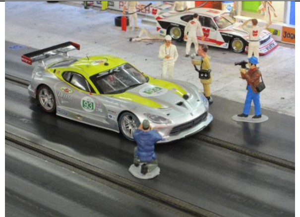
Karl-Heinz St.: Viper GTS-R