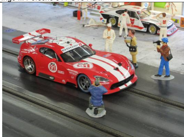
Carsten Sch.: Viper GTS-R