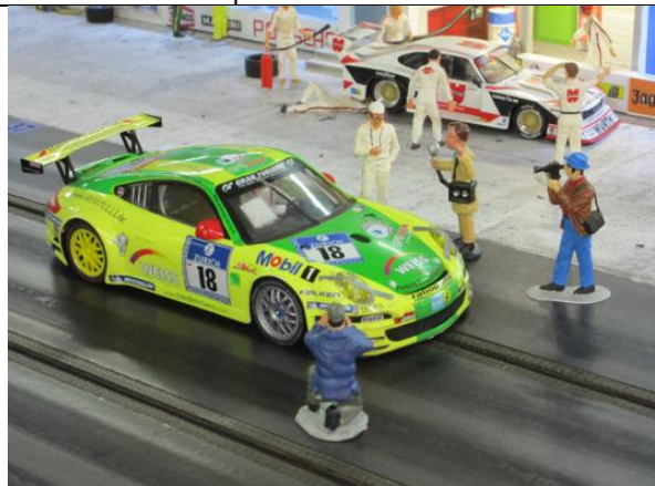
Ingo I.: Porsche 911 GT3 RSR