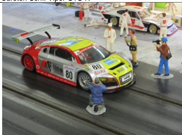
Ingo I.: Audi R8 LMS GT3