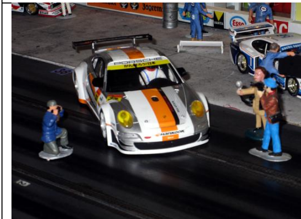
Sven F.: Porsche 911 GT3 RSR