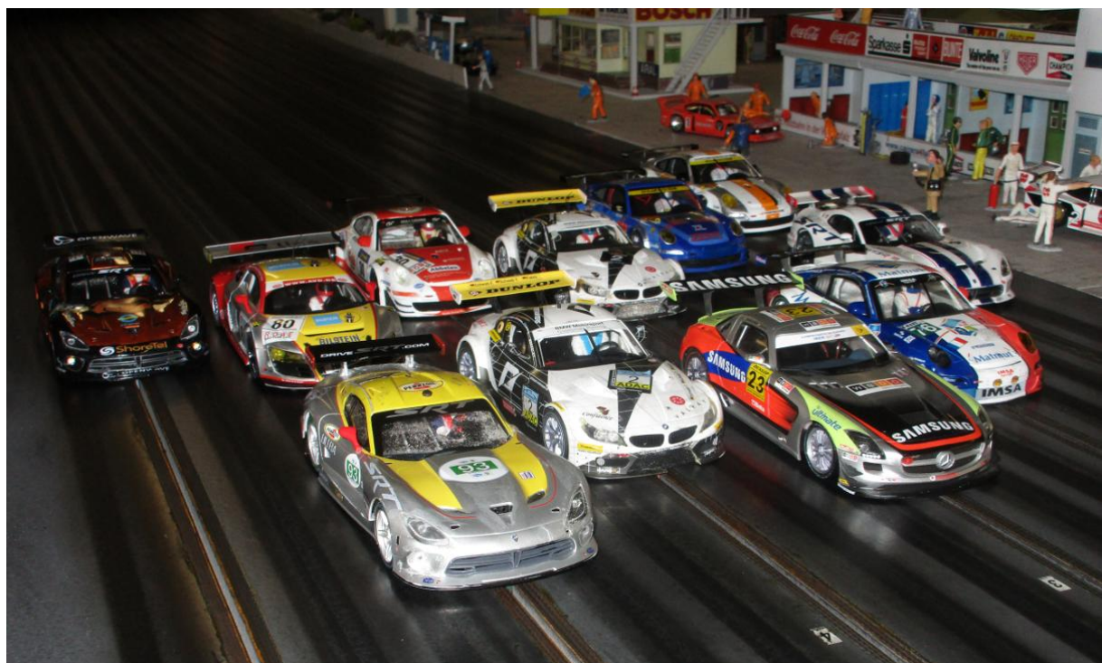
Das Fahrerfeld wartet auf den Start