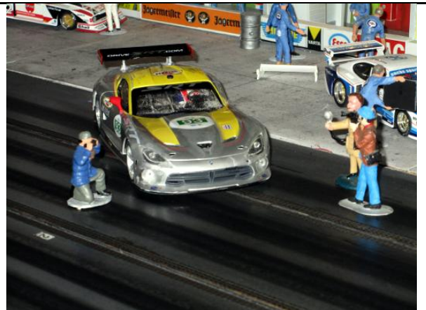
Karl-Heinz St.: Viper GTS-R