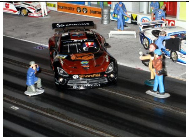
Markus S.: Viper GTS-R