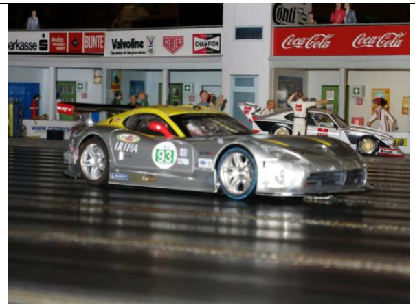
Karl-Heinz St.: Viper GTS-R