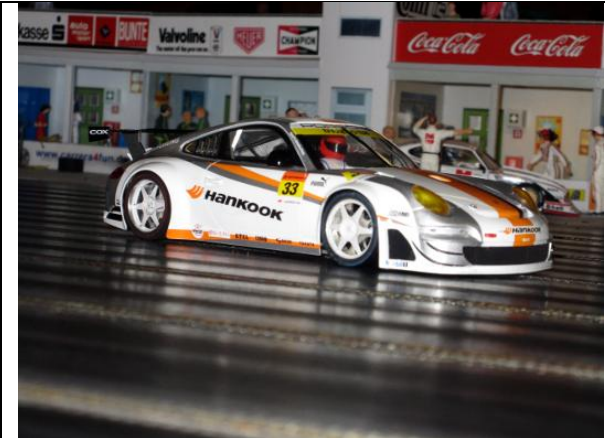
Sven F.: Porsche 911 GT3 RSR