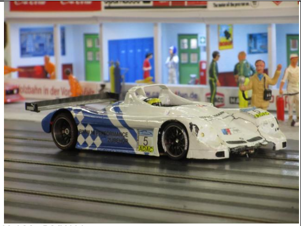
Kai M.: BMW V12