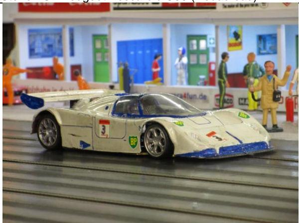
Karl-Heinz St.: Jaguar XJ9R